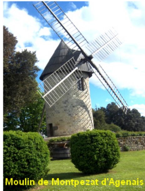
Moulin de Montpezat d'Agenais