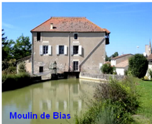
Moulin de Bias