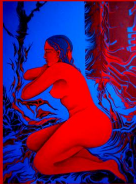
CARMEN - Huile sur toile - 65 cm x 80

Vernissage le Vendredi 11 septembre 2015 à partir de 18 heures