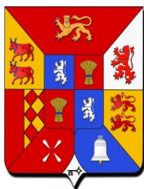
Blason sintetic deus país gascons

Novenpopulania - Baskoniako dukerria Gilen Antsoren menpean, X. mendean Gaskoinia linguistikoa XIX. mendearen amaieran