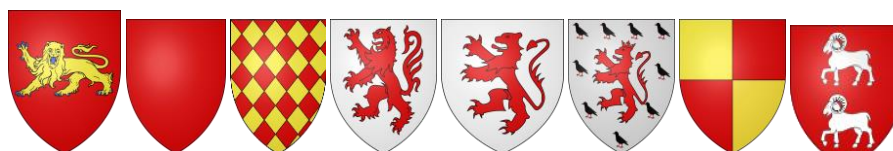
Bordalés Labrit Marçan Armanhac Fesençac Pardiac Astarac Lomanha