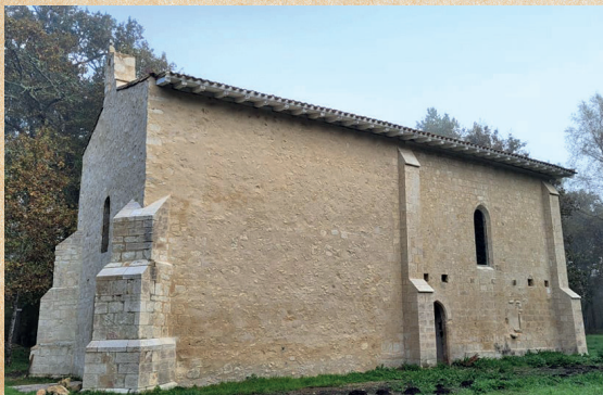
Avant et après restauration

Renseignements : mairie de Landiras 05 56 62 50 28 mairie.landiras@wanadoo.fr