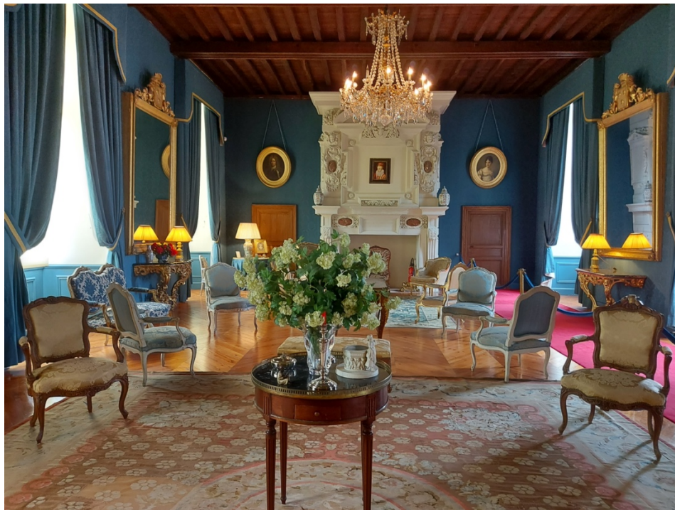
Salon de la Reine Margot