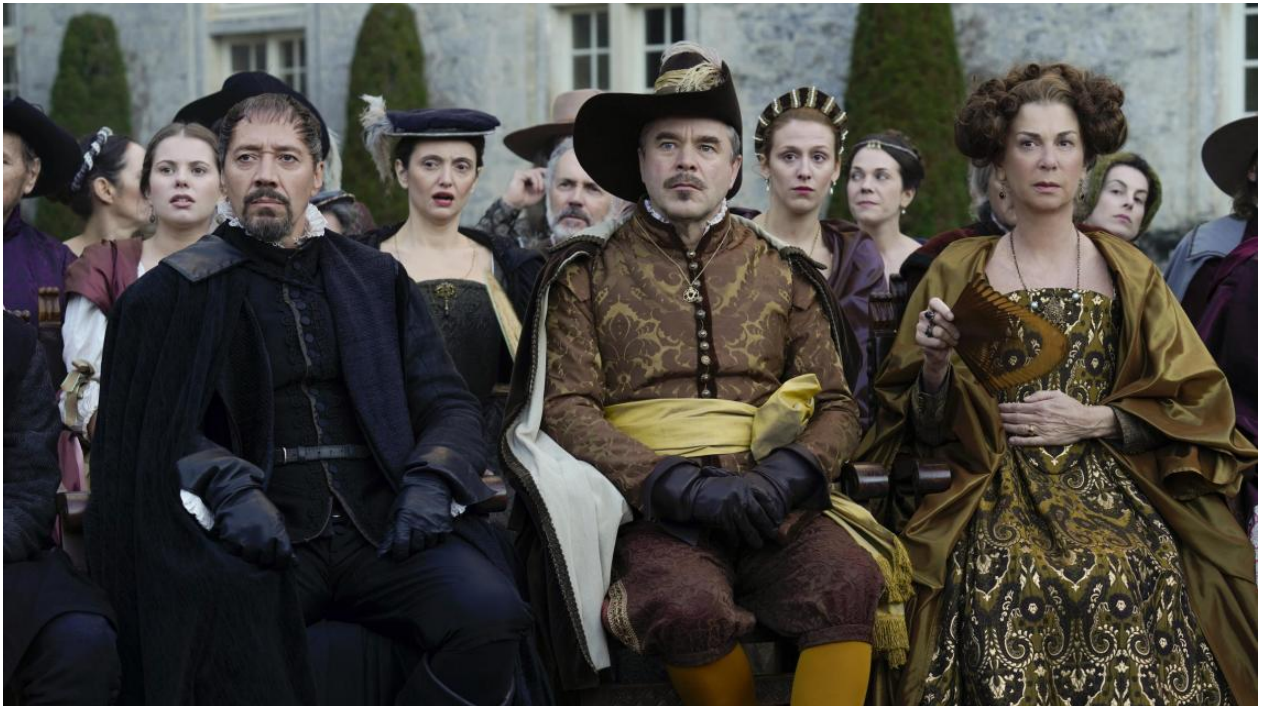
Scène tournée dans la cour d'honneur du Château Royal de Cazeneuve