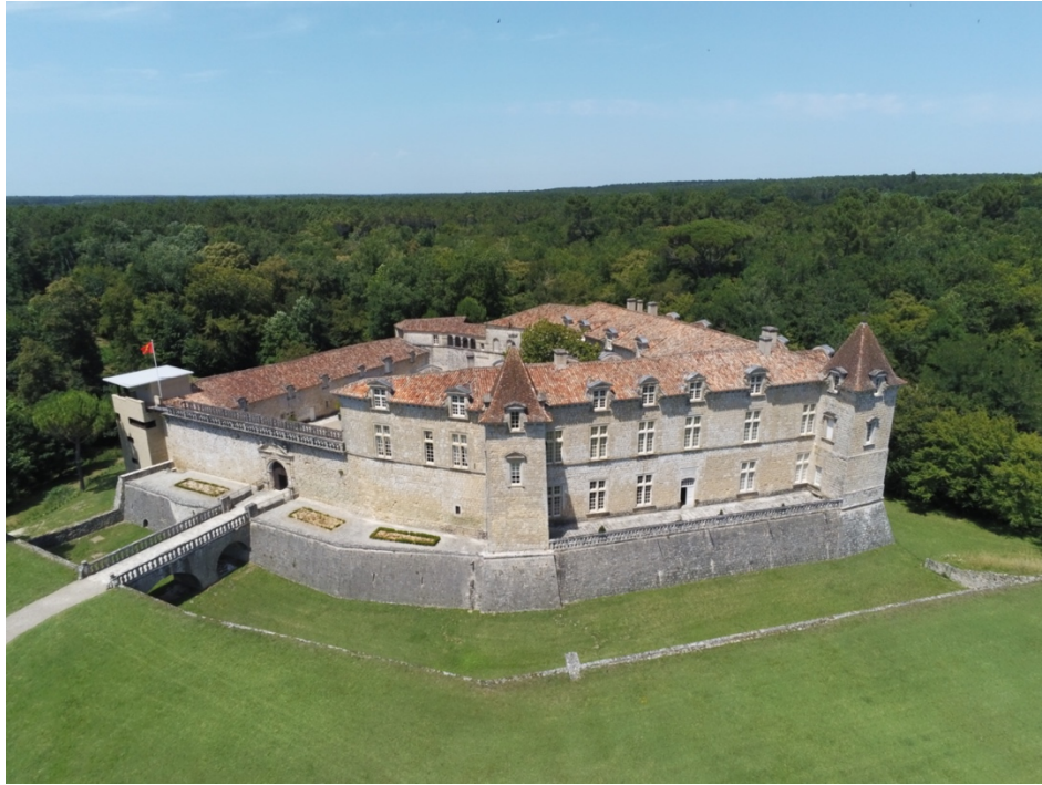
Vue aérienne du Château Royal de Cazeneuve