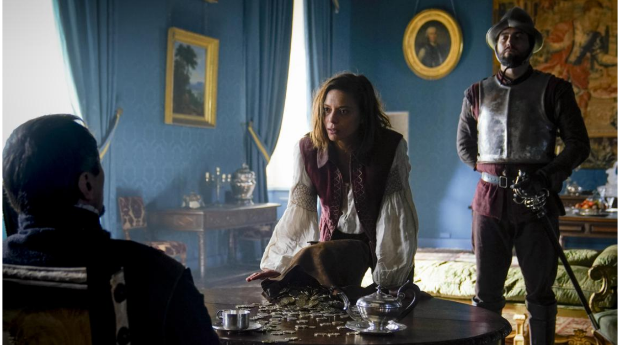
Scène tournée dans la Salon de la Reine Margot – Château Royal de Cazeneuve