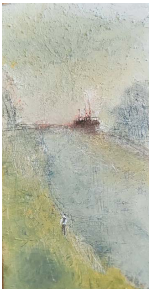
Morceau d'horizon°11 - huile et encre sur bois