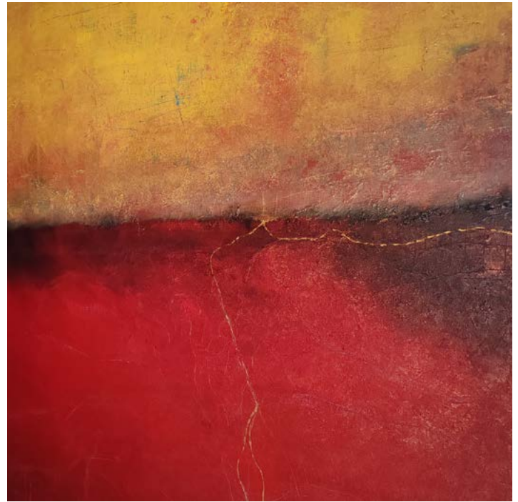
Les atmosphériques, 16 - technique mixte sur toile de lin

Avec Les Horizons retrouvés , l'artiste présente un travail pictural centré sur la couleur, la matière et la profondeur.